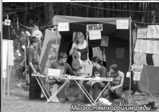
Мы гостям хорошим рады...

Как много зрителей приехало на фестиваль «Второго канала»! И каждый приехал, чтобы услышать любимого автора и исполнителя. Но кто же всё-таки является звездой фестиваля? Мы решили провести опрос зрителей. Наши корреспонденты обращались к ним с просьбой назвать трёх любимых авторов и исполнителей из присутствующих на фестивале.